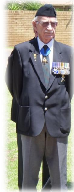
Lt genl Raymond Holtzhausen